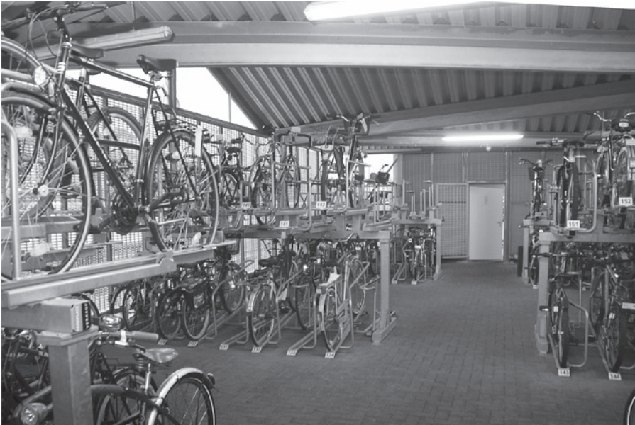
Hier sind die Räder sicher untergebracht: die großzügige Halle mit den Stellplätzen

Wir haben uns auch die Zugangsmöglichkeiten zur Stellanlage zeigen lassen. Mit einer Chipkarte kommt man rund um die Uhr in die Stellanlage. Die Chipkarte kann zurzeit allerdings nur zu den Öffnungszeiten der Radstation erworben werden. Die Funktionsdauer der Chipkarte ist frei wählbar. Die Tageskarte kostet